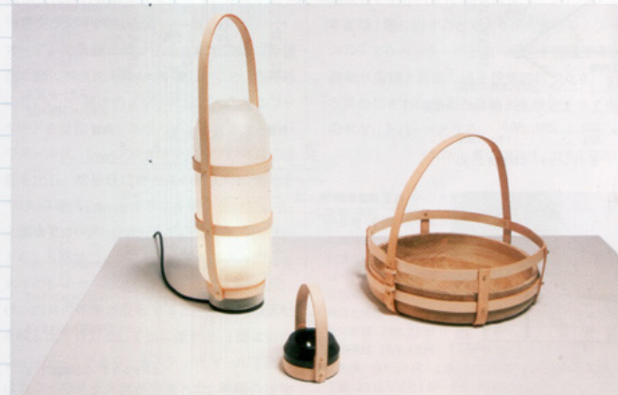
馬具づくりの技術に応用し、革のストラップを使ってデザインされたリミテッドエディション作品「エイントゥリー」。手前中央はペーパーウェイト。2011年秋、ロンドンで開催された「ヴェラ・チャプター・ワン」展で発表された

— デザイナーとしてのビジョンは何ですか。 個人的には、第一に、自分が楽しめることをしていきたい。そしてうまく行けば、私がデザインしたものが人が楽しめて、その人ともが一緒に歳を取っていきけるといいですね。あとは、私たちデザイナーの仕事が、今の世代よりも影響力を持っていくが望ましい。ものがあふれている現在は、社会の中でデザイナーとしての立場を意義あるものにするのは簡単ではありません。でも正しい方法でつくられたものには、やはり存在する権利があると思うのです。