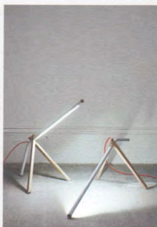
Mr Light #7 junior, 2009, lampada da terra /floor lamp, NextLevel Galerie