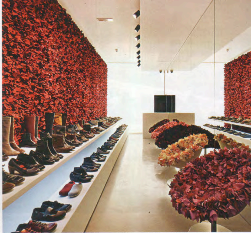
Tokujin Yoshioka, London