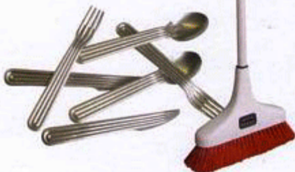
Couverts en aluminium, design Tomás Alonso