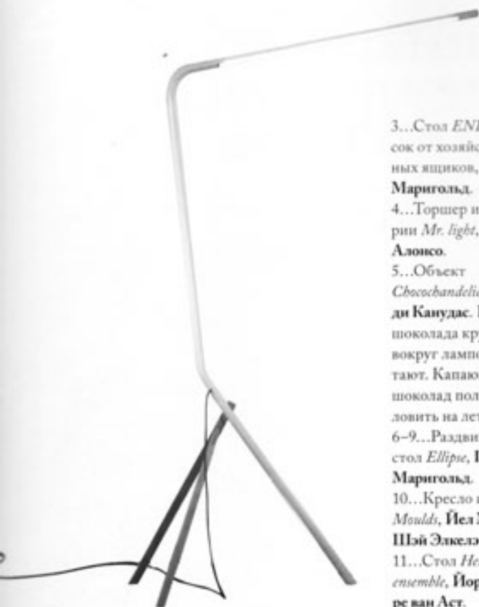
3...Стол END из досок от хозяйственных ящиков, Питер Маригольд. 4...Торшер из серии Mr. light , Томас Алонсо. 5...Объект Chocochandelier , Йорди Канудас. Плитки шоколада крутятся вокруг лампочки и тают. Капающий шоколад полагается ловить на лету. 6-9...Раздвижной стол Ellipse , Питер Маригольд. 10...Кресло из серии Moulds , Йел Мер и Шэй Элкелэй. 11...Стол Hexagon ensemble , Йорре ван Аст.