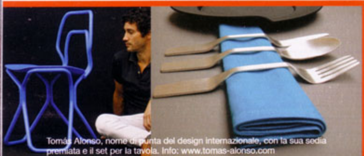
Tomás Alonso, nome di punta del design internazionale, con la sua sedia premiata e il set per la tavola. Info: www.tomas-alonso.com

La plastica declinata in tutte le sue diverse forme: dal polipropilene al pvc. Poi l'architetto e designer Barbara Del Brocco aggiunge una pietra dura qui, qualche perla di fiume là, e magari una ciliegina... ancora di plastica. Info: www.myspace.com/barbaradelbrocco